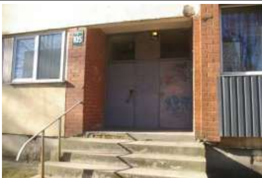
Būve ar kadastra apzīmējumu 1700 011 0160 001