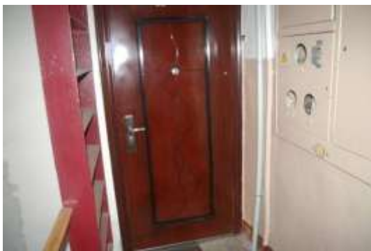
Būve ar kadastra apzīmējumu 1700 011 0160 001, dzīvoklis Nr.12