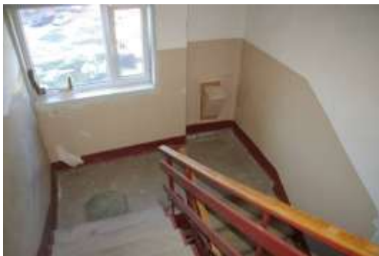
Būve ar kadastra apzīmējumu 1700 011 0160 001, koplietošanas telpa